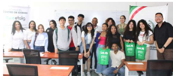
Estudiantes fortalecen su inglés en jornada de Spelling Bee UAJS

La capacitación fue liderada por el reconocido experto internacional Jermaine S. McDougald , quien compartió estrategias innovadoras para la enseñanza y el desarrollo del liderazgo en el ámbito educativo. Durante el programa, los